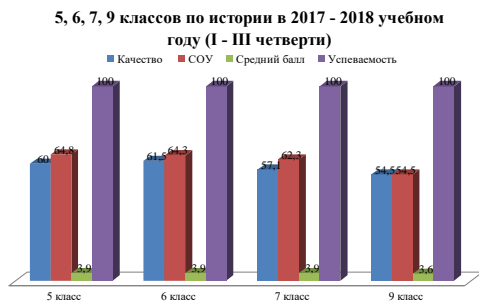
Мониторинг освоения обучающимися образовательных программ по истории